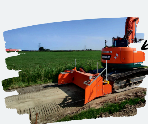
Het Blade in real life

Het TDB Excavator Blade is perfect geschikt voor montage aan een graafmachine. Het kan dienen als kilver en als duwblad, afhankelijk van de machine waaraan het wordt bevestigd en de werkzaamheden die je wilt uitvoeren. Alle bedieningselementen van het Blade zijn geïntegreerd onder een kap, wat niet alleen zorgt voor bescherming van de mechanismen, maar ook voor een nette afwerking van het Blade.