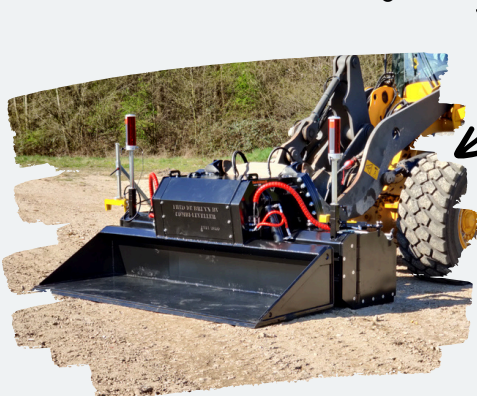
De Leveller in real life

De TDB Combi Leveller Type Tilt is perfect voor bredere machines. De Leveller heeft een kantelstuk aan de snelwissel waardoor de machine onafhankelijk van de Leveller kan kantelen, met behulp van kantelcilinders. Het kantelstuk heeft aan één kant een aparte vorm om zo veel mogelijk draagvlak te behouden tijdens het bewegen. Alle aansturing van de Leveller zit opgebouwd onder een kap, dit zorgt voor de bescherming van de mechanismen, maar ook dat de Leveller mooi afgewerkt uitziet.